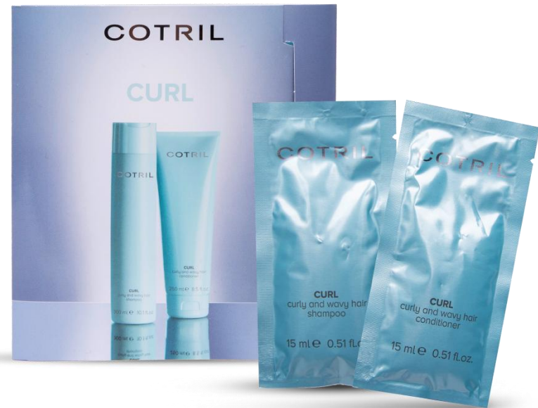
KOPL3164 Saszetki CURL szampon 15 ml + odżywka 15 ml