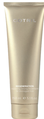
Repairing treatment for damaged hair