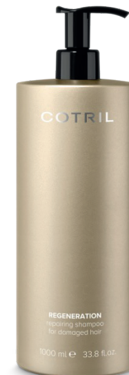
Repairing shampoo for damaged hair