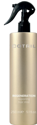
Repairing hair mist