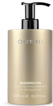
Repairing treatment for damaged hair