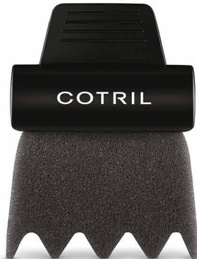
GABKA COTRIL KOPRO1990