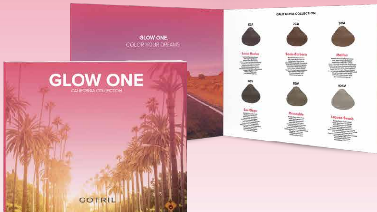
KOCAC1070 Karta kolorów